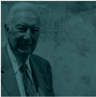
Antoni Vila Casas Presidente de la Fundació Vila Casas